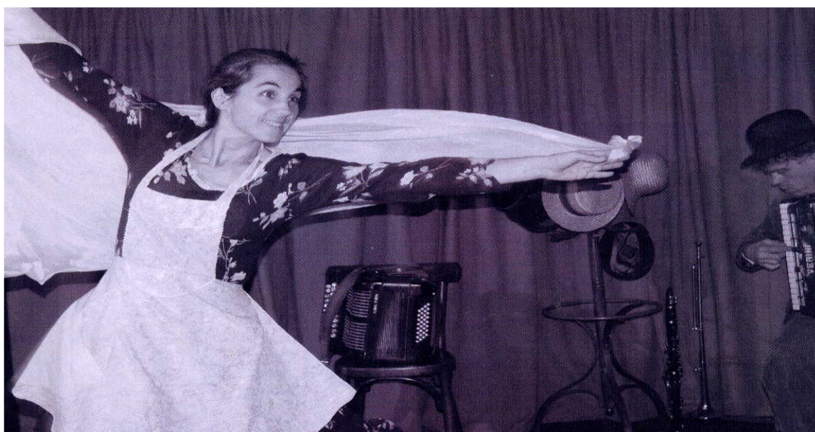
A erva Ruim